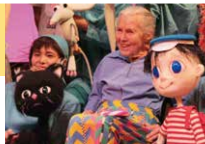
▲2018年来日時、紀伊國屋ホールにて

「私たちの心には、エルマーがいます。彼は飛びたがっています。彼は、自分の頭と心を使い、自分で考えることで、空を飛べるし、世界をもっと良い場所にできると気付いたのです。あなたならできます。」