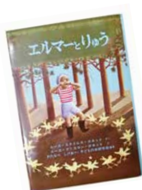
▲『エルマーとりゅう』原作本