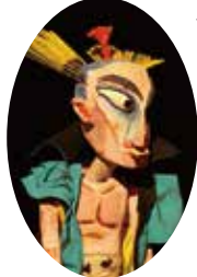
【人形劇ならではの個性的なフォルムをした登場人物】